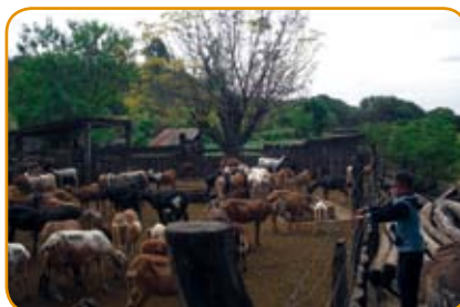
Creación de Granjas Ovinas en Charagua - Fundación Arakuaarenda