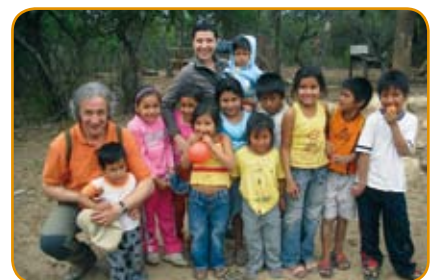
Niños de la comunidad Guaraní de Caipepe - Charagua