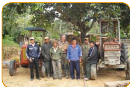
Maquinaria agrícola en Charagua - Asamblea del Pueblo Guaraní