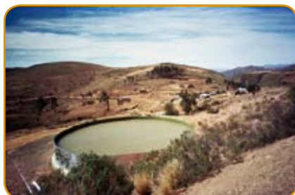
Construcción de atajados en Cochabamba - CIPCA