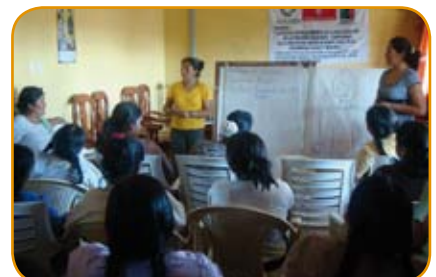
Convenio capacitación mujeres líderes campesinas - BdR/Paeria/CEDESCO