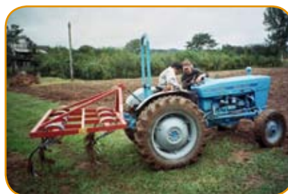
Tractor trabajando en tierras guaraníes